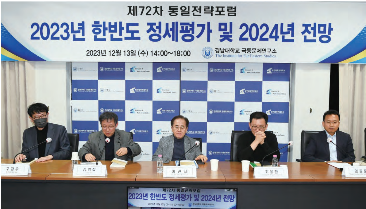
Presenters of the seminar/webinar “The Korean Peninsula in a Rapidly Changing World Order: Changes in the North Korean Situation and Prospects for Inter-Korean Relations”