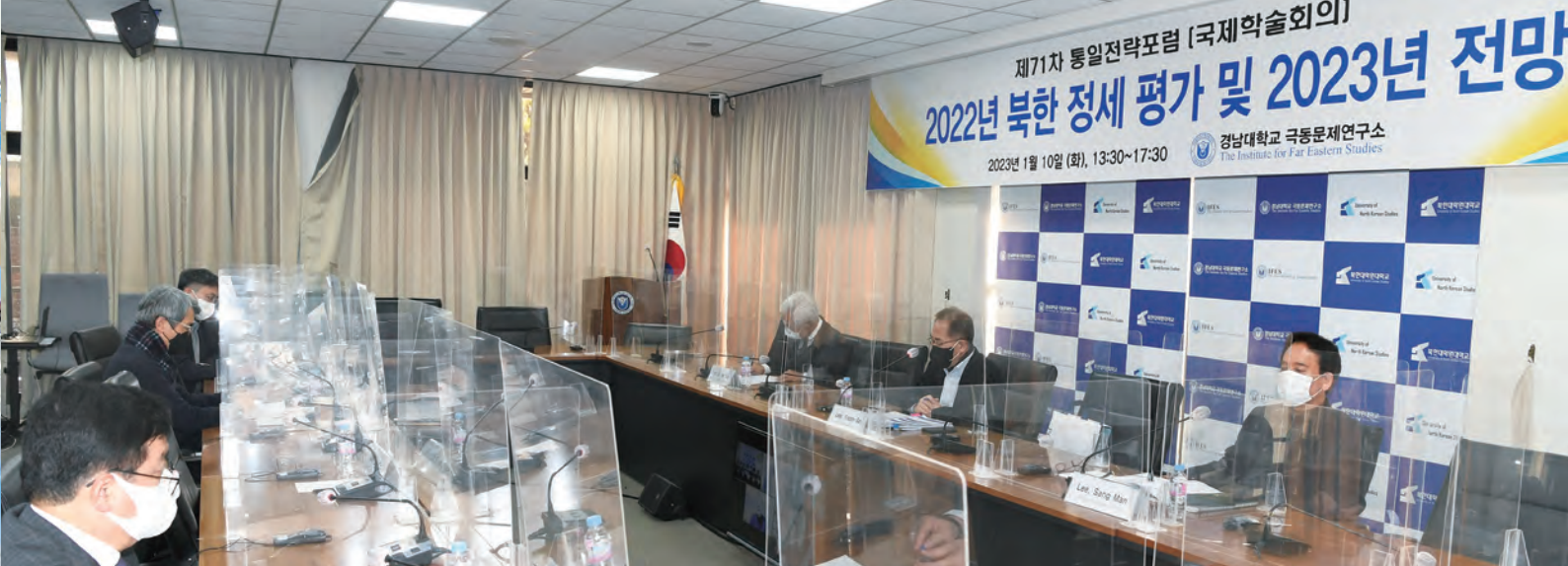
2022년 북한 정세 평가 및 2023년 전망 (2023.1.10)