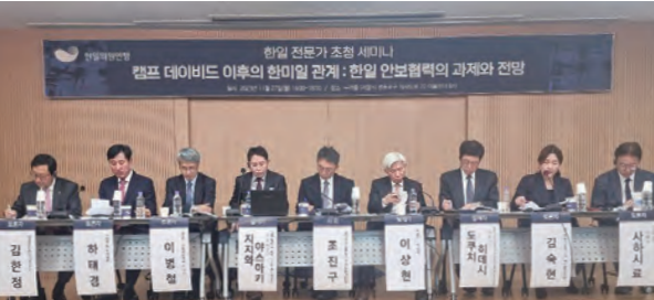
“캠프 데이비드 이후의 한미일 관계: 한일 안보협력의 과제와 전망” 세미나에 참석한 발표, 토론자들