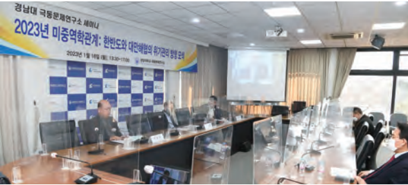
Presenters of the seminar/webinar “Foreign Policy ‘The Prospects of Cross-Strait Relations in Xi Jinping’s Third Term and Its Relevance to the Korean Peninsula’”