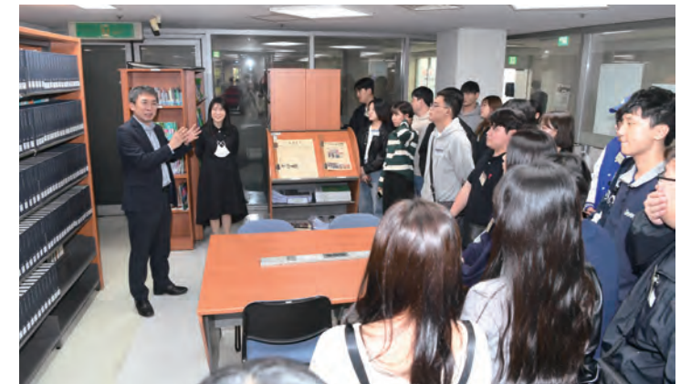
Visit to the library, North Korean Archives Special Collections (2023.10.13)

In 2023, the Library of the Institute for Far Eastern Studies at Kyungnam University organized 25 Library Information Sessions, with a total of 301 visitors, including domestic and international researchers, students, and political figures. User orientation is a key component of the session to boost North Korea and unification research and strengthen national competitiveness by expanding both domestic and international bases, forming physical and human networks, and sharing academic and policy achievements. The session provided an introduction and guidance on utilizing special collections published by North Korea, domestic and foreign materials, and research works pertaining to North Korea and unification, materials and information donated by renowned figures, and the database system established by the Institute for Far Eastern Studies at Kyungnam University. Looking ahead, the institute plans to broaden the scope of sharing and utilizing the library's materials.