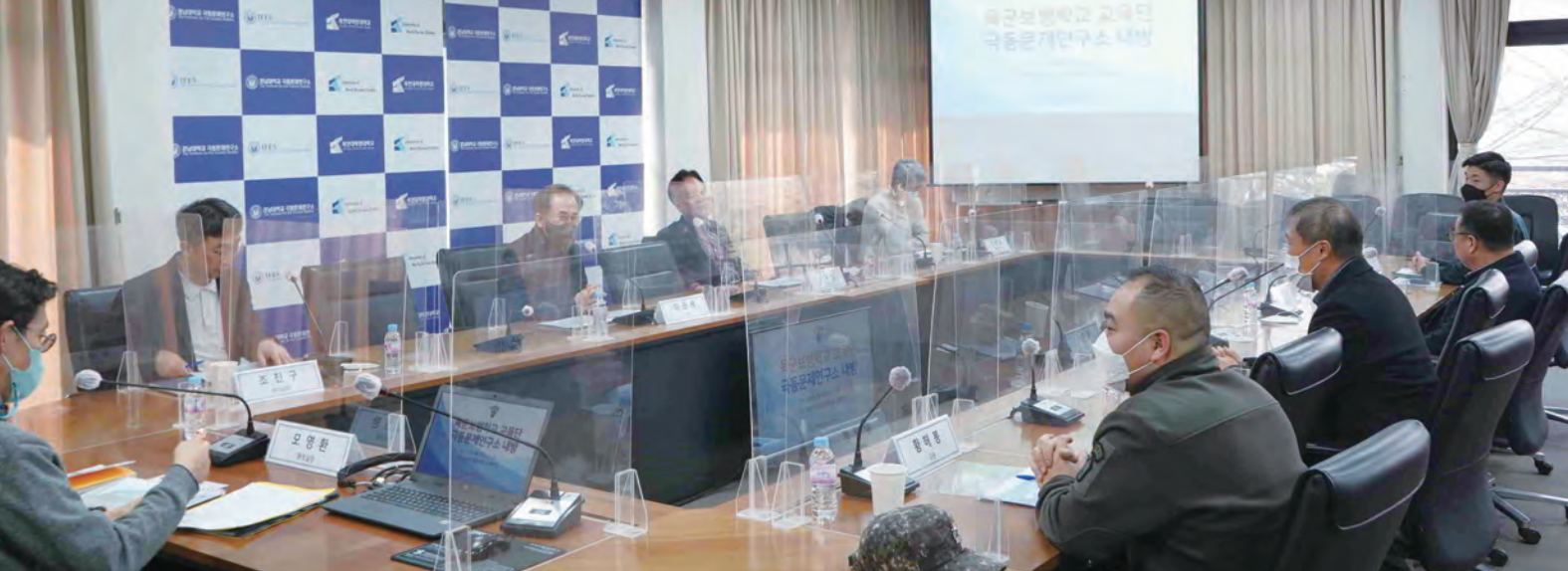
육군보병학교 교육단 간담회 (2023.2.24)