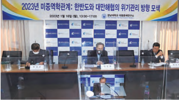
제1세션 “정치, 경제 분야에 참석한 발표,토론자들”