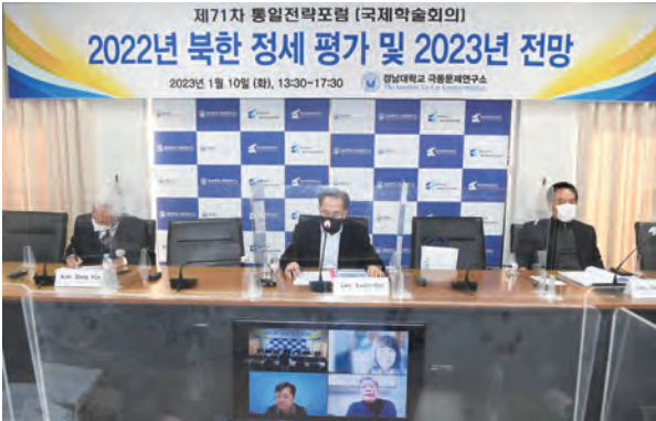
제1세션 정치, 군사, 경제 세션에 참석한 발표, 토론자들

“2022년 북한 정세 평가 및 2023년 전망”을 주제로 개최된 통일전략포럼은 북한의 정치·군사·경제·대외·대남 총 5개 세부 주제에 대해 2개 세션으로 나뉘어 진행되었다.