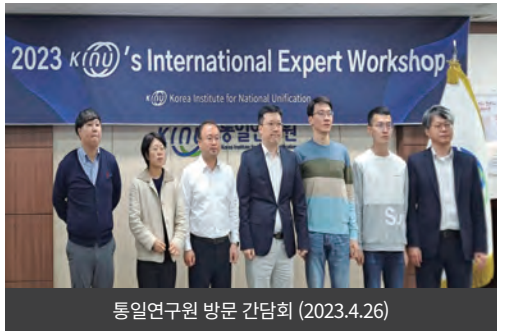
통일연구원 방문 간담회 (2023.4.26)