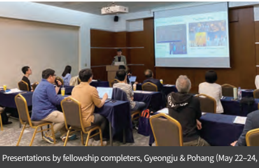
Presentations by fellowship completers, Gyeongju & Pohang (May 22-24, 2023)

3 Workshops, 2 Visits to Relevant Institutions, 1 Field Trip in 2023