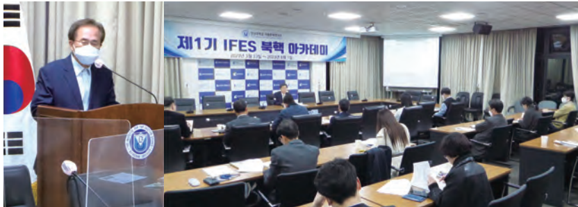
IFES 북핵 아카데미 제1기 개강식 (2023.3.23) IFES North Korea Nuclear Academy 1th Opening Ceremony (2023.3.23)

경남대 극동문제연구소는 1999년부터 국내 최초로 남북경협 전문가 양성 프로그램인 ‘남북경협 아카데미’를 운영하였고, 2014년부터는 콘텐츠와 진행 방식을 대폭 개선한 ‘IFES 통일경제아카데미’를 운영하였다. 2023년부터는 북한 핵에 대한 실상을 평가·분석하고, 이의 해결 전략과 대안을 모색하고자 「IFES 북핵 아카데미」를 개설하여 현장 경험과 이론을 겸비한 전·현직 고위 관료 및 최고의 전문가들을 초빙, 북핵 전반적인 부분에 대해 심도있게 탐구하는 교육과정을 진행하였다.