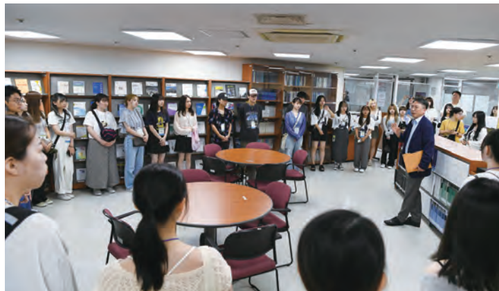
북한자료실 특수자료, 도서관 견학 (2023.8.16)

2023년 한해 경남대 극동문제연구소 도서관은 국내외 연구자, 학생, 정관계 인사 등을 대상으로 총 25회(301명) 방문자를 대상으로 설명회를 실시했다. 본 설명회는 국내외 저변 확대와 물적, 인적 네트워크 형성, 학문적, 정책적 성과 공유를 통한 북한·통일 연구의 활성화와 이 분야에서의 국가경쟁력을 강화하기 위한 목적의 일환으로 진행되어져 오고 있다. 경남대 극동문제연구소가 소장하고 있는 북한 발간 특수자료들, 북한·통일 관련 국내외 자료와 연구 성과물, 저명 인사들이 기부한 자료와 정보 및 자체 구축한 데이터 베이스 시스템을 소개하고 이를 활용하는 내용으로 진행되었다. 연구소는 도서관의 자료 공유와 활용의 폭을 확대해 나갈 것이다.