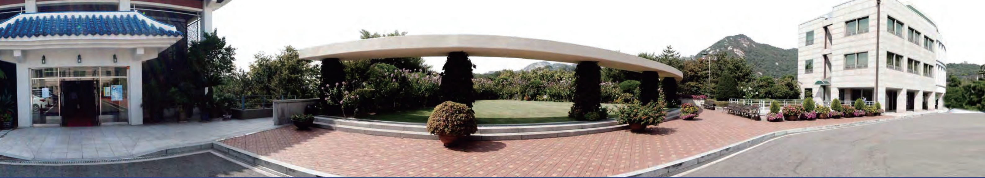
서울 삼청동에 위치한 경남대 극동문제연구소 전경