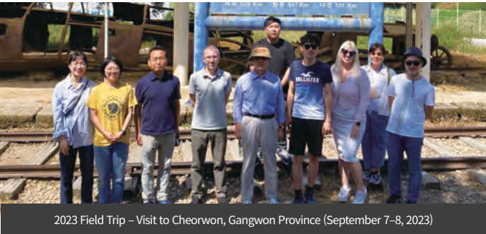
2023 Field Trip - Visit to Cheorwon, Gangwon Province (September 7-8, 2023)