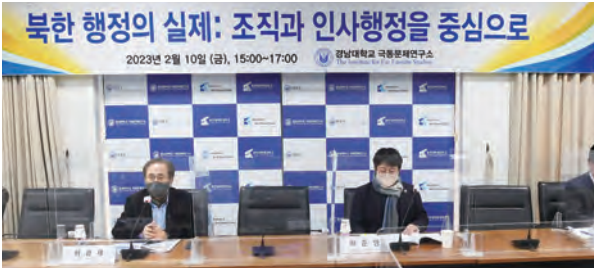
“북한 행정의 실제: 조직과 인사행정을 중심으로” 세미나에 참석한 발표,토론자들