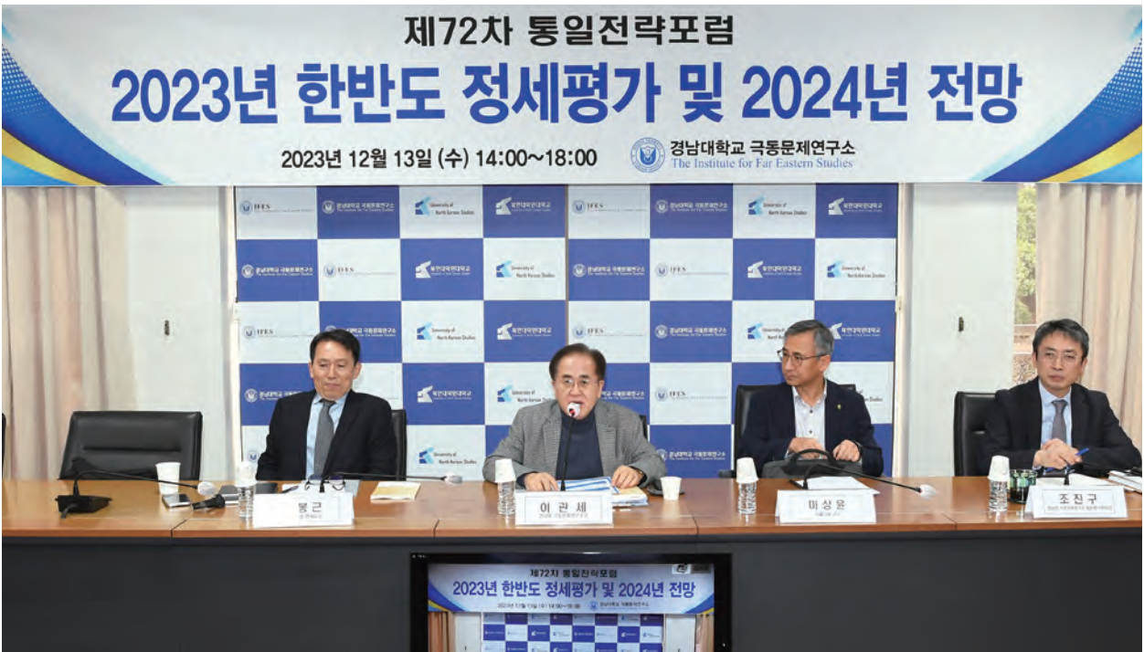
제1세션 “한·미·일 협력 구조 변화의 작용·반작용”