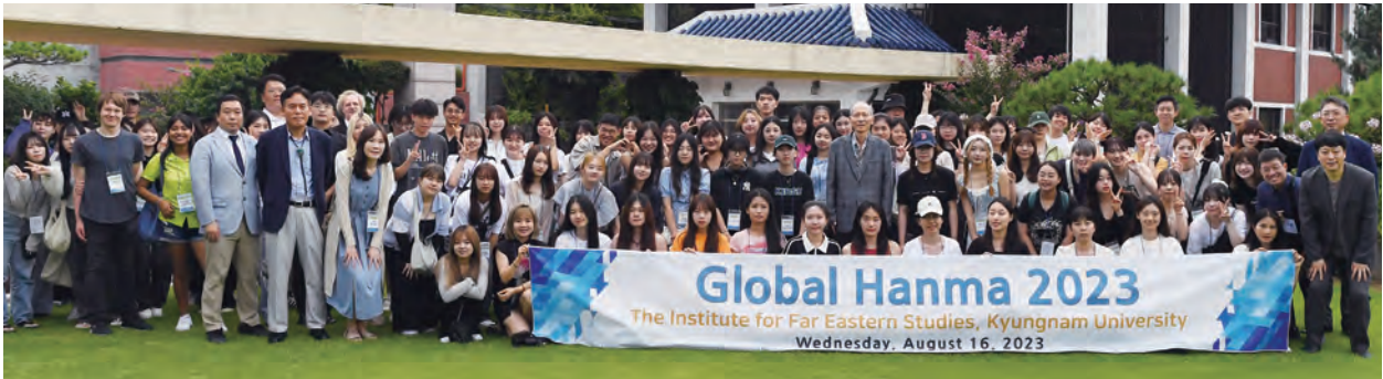
A total of 79 overseas university students—35 from Japan, 31 from China, 10 from Taiwan, and one each from the United States and Mexico—visited the IFES as part of Kyungnam University’s ‘2023 Global Hanma program. (August 16)

of Kyungnam University’s “2023 Global Hanma” program. Participants watched promotional videos about IFES and the University of North Korean Studies, toured the library, interacted with the institute’s faculty members.