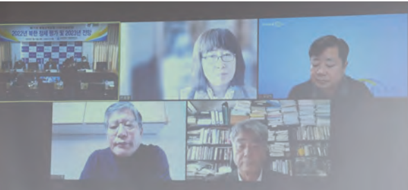
The 71st Unification Strategy Forum’ as a international conference/webinar

The forum, held under the title “North Korea: Assessment of 2022 and Outlook for 2023” was divided into two sessions on five specific topics: North Korea’s politics, military, economy, foreign policy strategy, and policy toward South Korea.