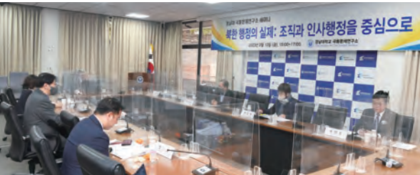
Presenters of the seminar/webinar “The Reality of North Korea’s Administration: Focusing on Organizational and Public Personnel Administration”