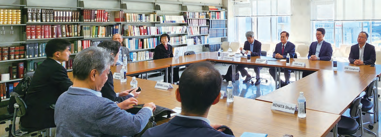
일본 게이오대 라운드테이블 (2023.10.26 장소:일본 게이오대)