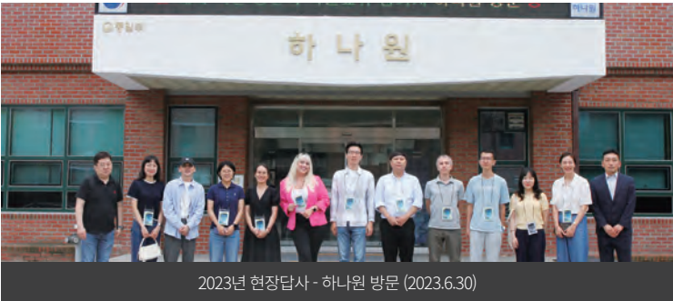
2023년 현장답사 - 하나원 방문 (2023.6.30)