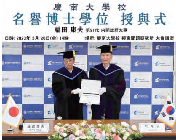
박재규 경남대학교 총장은 후쿠다 야스오 전 일본 91대 내각총리대신에게 명예정치학박사 학위기 수여