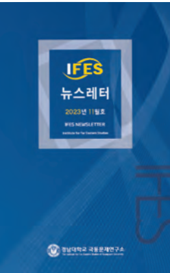
2023년 11월호 (개편호) 2023. 11 Issue (Reformed Edition)

경남대 극동문제연구소는 연구소 설립 50주년을 기점으로 연구소의 연구·학술 사업과 교육, 대외교류 활동사항을 체계적으로 정리하여 매월 『경남대 극동문제연구소 뉴스레터』를 발간해 오고 있다. 앞으로도 연구소는 뉴스레터를 꾸준히 확대·발전시켜 학계 및 일반 대중들의 연구소 접근성을 높이고 소통의 창구로 만들어 나갈 계획이다.