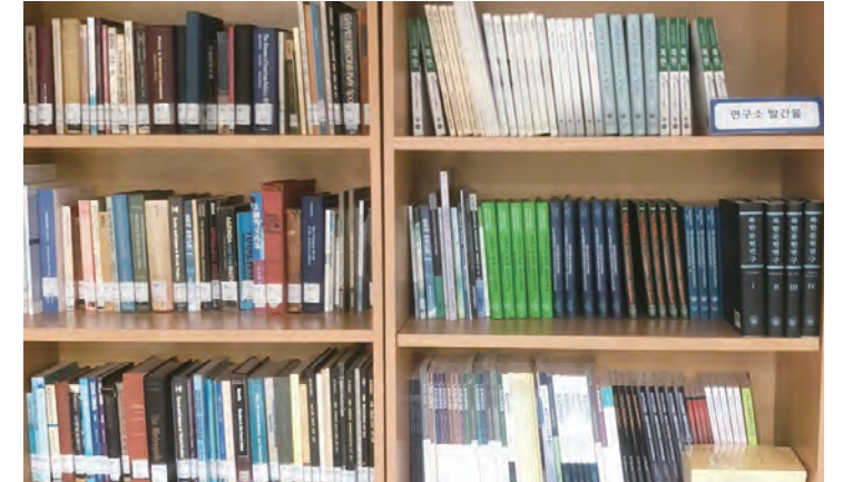
Books in the Book-Sharing Corner

Since 2022, Book-Sharing has been a component of diverse programs aimed at invigorating research and enhancing the research environment. The objective is to broaden access to research materials, foster interest, and promote research endeavors among current and aspiring researchers specializing in North Korean and unification studies. The Book-Sharing Corner features a collection of outstanding books and textbooks on international politics, North Korea, and unification, published by the IFES and the University of North Korean Studies. These valuable resources are available for use by anyone. Furthermore, in the spirit of sharing and circulation, the library is recycling resources and creating opportunities for future researchers to delve into a wealth of prior research materials. The library intends to extend the scope of mutual book donations and evolve it into a platform for knowledge sharing and circulation, which will ultimately contribute to the vitalization of research activities.