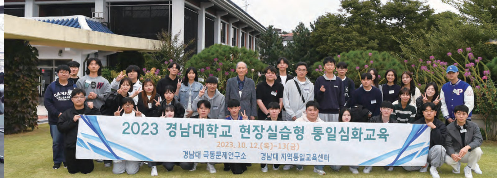
2023 경남대학교 현장실습형 통일 심화교육 (2023.10.13)