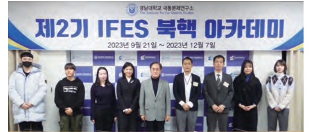
IFES 북핵 아카데미 제2기 수료식 (2023.12.7) IFES North Korea Nuclear Academy 2th Opening Ceremony (2023.12.7)

The academy engages former and current senior officials, along with top experts with a combination of practical field experience and theoretical expertise, to provide in-depth