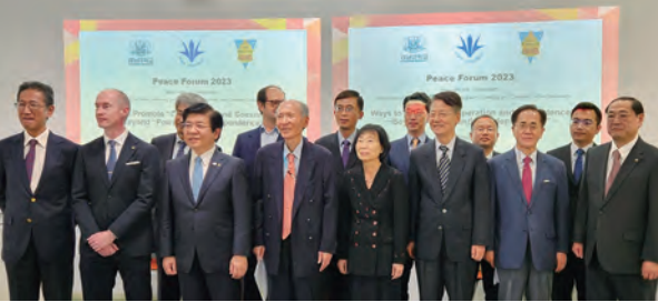
2023 평화포럼에 참석한 주요 참석자와 발표·토론자 (주요 참석자: 앞줄 좌측 3번째부터 스즈키 마사시 소카대 총장, 박재규 경남대 총장, 김선향 북한대학원대 이사장, 자오젠민 중국문화대학 사회과학대학장)