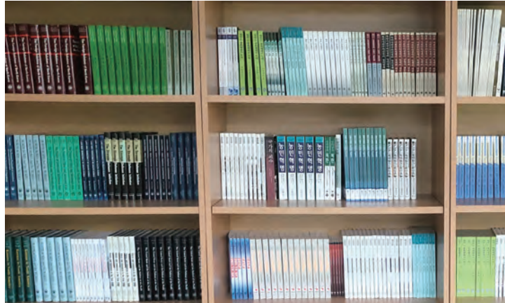
도서관라운지에 설치된 나눔서가

도서관 나눔 행사는 2022년부터 연구 활성화 및 연구 환경 개선 프로그램의 일환으로 진행되고 있으며, 북한·통일 연구자들과 예비 연구자들에게 도서 공유를 통하여 연구자료에 대한 접근성을 제고시키고 이에 대한 관심과 연구를 더욱 증진시키는 것을 목적으로 한다. 도서관 나눔 코너에는 본 연구소와 북한대학원대학교에서 발간한 국제 정치 및 북한·통일 관련 우수 도서, 교재 등이 비치되어 있어 누구나 활용이 가능하다. 또한 나눔과 순환이라는 취지에서 자원 재활용과 후대 연구자들에게 선행 연구 자료 탐독의 기회를 제공하고 있다. 도서관은 도서관 나눔을 도서 상호 기부의 저변을 확대하고 지식 공유, 나눔, 순환의 플랫폼으로 더욱 발전시키며 궁극적으로 연구 활성화로 연결 될 수 있도록 노력해 나갈 계획이다.